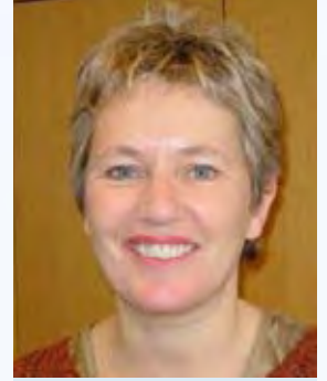
سالي جان رينوود

والأدلة على التغيير المناخي، الناتج عن انبعاثات ثاني أكسيد الكربون جراء الأنشطة البشرية، قد بلغت الآن حدًا لم يسبق له مثيل ولها نتائج لا يمكن توقعها وقد تكون كارثية على الناس والطبيعة على حد سواء. أما عصر النفط الرخيص فقد أزف على الانتهاء، مع تزايد الطلب واستقرار العرض، وما يحمله ذلك من تأثيرات عميقة على الاقتصاد السياسي العالمي. لقد تسببت الأزمة المالية الحالية، والتي بدأت في الولايات المتحدة الأمريكية، بانهايار مصارف عملاقة، وتحدي الاقتصاد العالمي بأسره، والتأثير سلبيًا على الوظائف والأعمال التجارية في كافة أنحاء العالم. إن هذه المواضيع كلها معتمدة على بعضها البعض ولديها أثر على الطبيعة وعلى الناس من خلال تأثيراتها المتسلسلة على الطعام والماء والطاقة وأمن الموارد. كما أنها بلغت مبلغها من السوء معًا، وبسرعة أكبر مما كان صانعو السياسات ليتخيلوه. ولا أحد بمنأى عن آثارها، وإن كانت تصيب المجموعات الأفقر والأكثر عرضة للأذى بشكل أفسى من غيرها. وبات من الواضح أننا نواجه تغييرات عميقة على الحياة التي عهدناها في القرن الماضي وليس ثمة خرائط طرق واضحة للمستقبل. إن أردنا أن نجتاز القرن الحادي والعشرين فعلى القيام بانتقال سريع وفعال نحو التنمية المستدامة. وللحركة البيئية دور رئيسي لتهض به في هذا الانتقال.